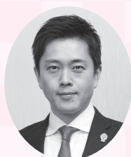
大阪府知事 吉村 洋文

新年を迎え、謹んで年頭のご挨拶を申し上げます。 いよいよこの4月、大阪・関西万博が開幕します。