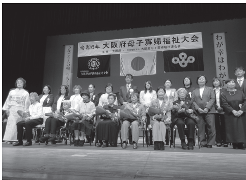
大阪府知事表彰を受賞された方々

令和6年2月12日(休日)クレオ大阪中央に於いて、約700名が参加し、国会議員、府議会議員他、多数の来賓の方々にご臨席いただき、大阪府母子寡婦福祉大会を開催しました。式典では、高齢寡婦